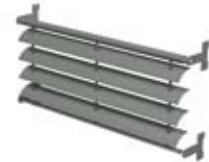
SYSTÈME DE CHÂSSIS BS 20