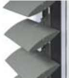
BS 100 AVEC SYSTÈME DE SERRAGE