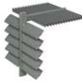
SYSTÈME BS 100 À LAMES FIXES