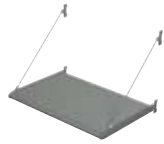
SYSTÈME DE CADRES PRÉASSEMBLÉS BS 100